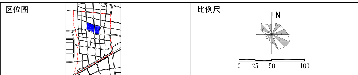
地块控制指标一览表